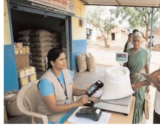
గోదాముల సమస్యల పరిష్కారం-కేంద్రం సూచనలు

ఇందుకోసం 2.15 లక్షల టన్నుల బియ్యం స్టాక్ను (అదనపు నిల్వలను) గడువు కంటే ముందే రాష్ట్రంలోని అన్ని చౌకధరల దుకాణాలకు (రేషన్ షాపులకు) విజయవంతంగా తరలించింది. దీనివల్ల నెల ప్రారంభంలోనే కాల్వదారులు ఎటువంటి నిరీక్షణ లేకుండా నేరుగా తమకు కేటాయించిన బియ్యాన్ని పొందే అవకాశం లభిస్తుంది.