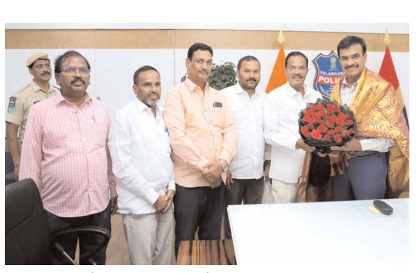
తెలంగాణ సూతన డీజీపీ సీపీ ఆనంద్ గారిని డీజీపీ ఆఫీస్ లో మర్యాద పూర్వకంగా కలిసి శు