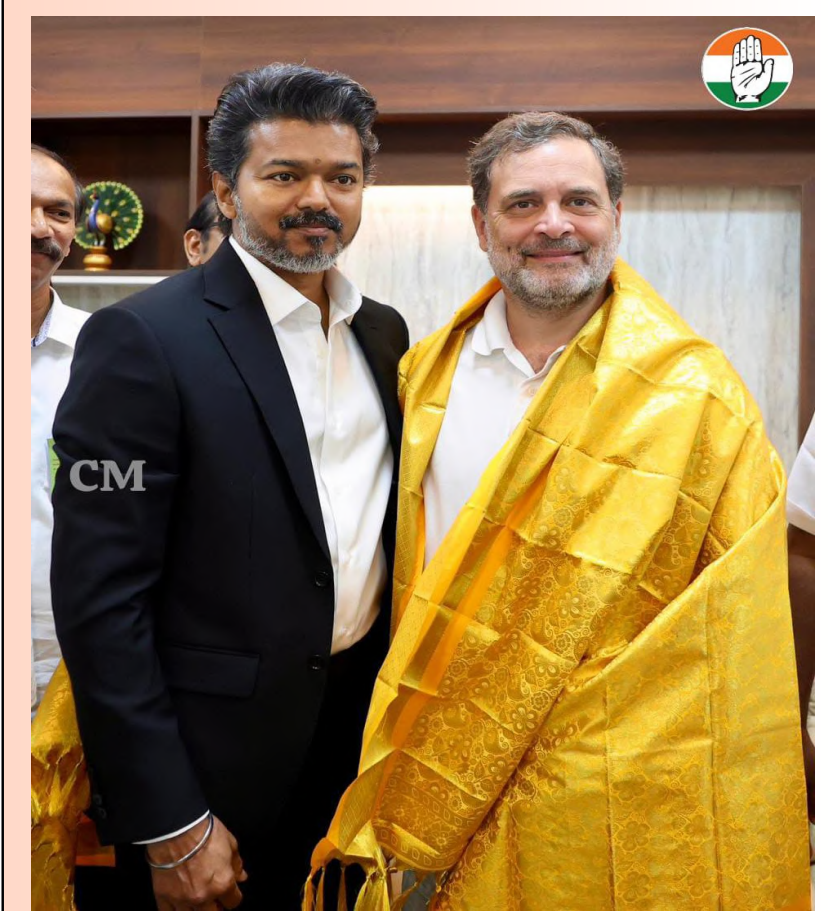
ప్రతిపక్ష నాయకుడు శ్రీ రాహుల్ గాంధీ, చెన్నైలో తమిళనాడు ముఖ్యమంత్రిగా శ్రీ టీవీకే విజయ్ హెచ్ క్యూ ప్రమాణ స్వీకార కార్యక్రమానికి హాజరయ్యారు.