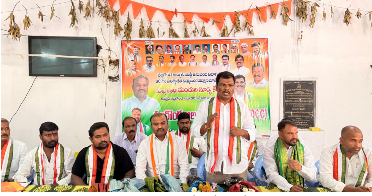
నల్గొండ టౌన్, అన్నదేతం మే 10: