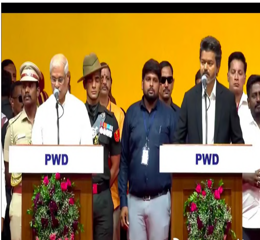
అన్నదేతం, బిమ్మం మే 10: ఆరుకోవాలని ఎస్సీ ఎస్సీ టీసీ మైనార్టీ ముస్లింల తమిళనాడు ముఖ్యమంత్రి శ్రీ గౌరవ శ్రీ జోసెఫ్ సబ్ షాన్ నిధులు వెంటనే ఆక్రమ మంజూరు చేయాలి ప్రతి ఒక్కరికి న్యాయం చేసేలా ముఖ్యమంత్రిగా ప్రమాణ స్వీకారం చేసిన దళిత మా అన్నగారికి ఉద్యమ సమస్యాలూ అన్ని కులాలను కలుపుకొని ప్రతి కుటుంబాలకు తెలియజేస్తున్నాం. మీ లంక వెంకటేశ్వర్లు ఎల్ అండగా ఉండాలని ముందుగా లేని వి ఆర్ ఎమ్మార్ఎస్ టీఎన్ జాతీయ ఉపాధ్యక్షులు దళిత రత్న అవార్డు గ్రహీత. కుటుంబాలను గుర్తించి ఆ కుటుంబాలను