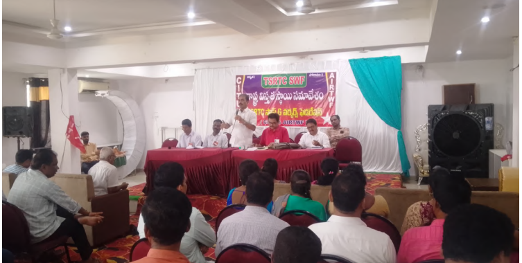
నల్గొండ టౌన్, అన్నదేతం మే 10: