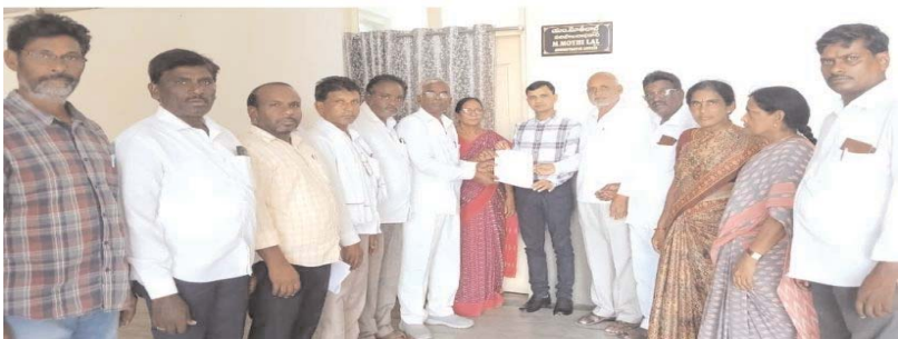
నల్గొండ టౌన్, అన్నేషనేత్రం, మే 5:

రైతు సంఘం ఆందోళన.. కలెక్టర్ కు వినతిపత్రం