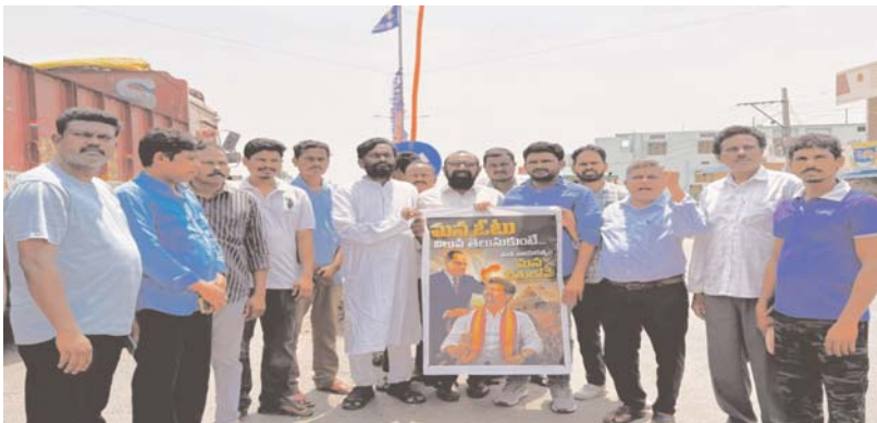
నేతలచుట్టే - మే 5 అన్వేషణ:

మతోన్మాద పార్టీని ఒక్క సీటుకే పరిమితం చేసిన తమిళ ప్రజలకు అభినందనలు బీసీ నేత ధనుంజయ నాయుడు వ్యాఖ్య