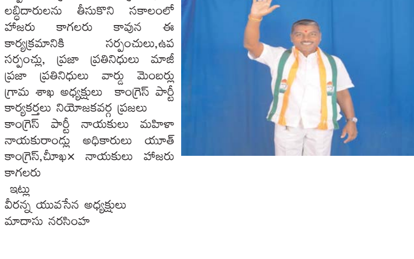
ఇట్లు వీరన్న యువనేన అధ్యక్షులు మాదాసు నరసింహ

05-05-2026 మంగళవారం రోజున ఉదయం 11:00గంటలకు విషయం:- కళ్యాణ లక్ష్మి షాదీ ముబారక్ చెక్కుల పంపిణీ.. వేదిక నార్కట్ పల్లి పట్టణశి లోని రేణుక ఎల్లమ్మ ఫంక్షన్ హాల్ లో అనగా 05-05-2026 మంగళవారం రోజున ఉదయం 11:00 గంటలకు మన ప్రయత్నం నాయకులు.. ప్రభుత్వ విప్, గౌరవ నకిరేకల్ ఎమ్మెల్యే శ్రీ వేముల వీరేశం అన్న గారు నార్కట్ పల్లి పట్టణంలోనే రేణుక ఎల్లమ్మ ఫంక్షన్ హాల్ లో కళ్యాణ లక్ష్మి షాదీ ముబారక్ చెక్కుల పంపిణీ కార్యక్రమానికి విచ్చేయనున్నారు కావున మండలంలోని ఆయా గ్రామాల సర్పంచులు, ప్రజా ప్రతినిధులు లబ్ధిదారులను తీసుకొని సకాలంలో హాజరు కాగలరు కావున ఈ కార్యక్రమానికి సర్పంచులు, ఉప సర్పంచులు, ప్రజా ప్రతినిధులు మాజీ ప్రజా ప్రతినిధులు వార్డు మెంబర్లు గ్రామ శాఖ అధ్యక్షులు కాంగ్రెస్ పార్టీ కార్యకర్తలు నియోజకవర్గ ప్రజలు కాంగ్రెస్ పార్టీ నాయకులు మహిళా నాయకురాండ్లు అధికారులు యాత్ కాంగ్రెస్, పీఠాంశ నాయకులు హాజరు కాగలరు