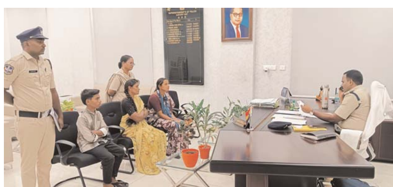
సూర్యాపేట జిల్లా సూపర్ మే: 04 (అన్వేషనేత్రం):