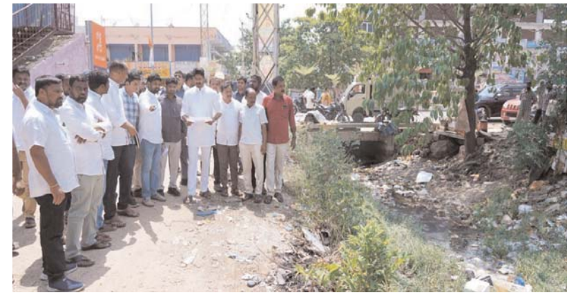
ఈరోజు నాగార్జునసాగర్ నియోజకవర్గంలోని, హలియా మున్సిపాలిటీ నందు పేరూరు మేజర్