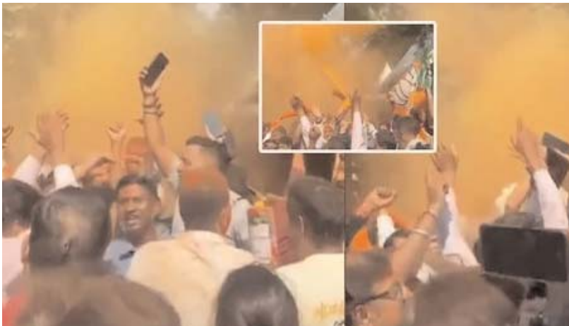
కోల్కతా, అన్వేషనేత్రం ప్రతినిధి

పశ్చిమ బెంగాల్, అస్సాం, పుదుచ్చేరి అసెంబ్లీ ఎన్నికల ఫలితాల్లో విజయం దిశగా బీజేపీ దూసుకుపోతోంది. అస్సాంలో గత రెండు అసెంబ్లీ ఎన్నికల్లోనూ బీజేపీనే విజయ ధంకా మోగించగా.. తాజాగా మూడోసారి విజయకేతనం ఎగరేస్తోంది. మొత్తం 126 స్థానాలకు గాను బీజేపీ 99 స్థానాల్లో అధికారం కనబరుస్తోంది. పశ్చిమ బెంగాల్లోనూ కమలం పార్టీ సత్తా చాటుతోంది. మొత్తం 294 స్థానాలకు గాను 197 సీట్లలో బీజేపీ ముందంజలో ఉంది. మమతా బెనర్జీ నేతృత్వంలోని టివిఎస్ కేవలం 93 స్థానాల్లోనే అధికారం ప్రదర్శిస్తోంది. దీంతో పశ్చిమ బెంగాల్లో బీజేపీ విజయం దాదాపు ఖాయమైపట్టు కనిపిస్తోంది. ఈ సందర్భంగా అస్సాం, పశ్చిమ బెంగాల్ రాష్ట్రాల్లో, అలాగే దేశవ్యాప్తంగా బీజేపీ శ్రేణుల సంబరాలు అంబరాన్ని అంటుతున్నాయి. కాషాయ దుస్తుల్లో రోడ్లపైకి వచ్చిన ఆ పార్టీ నేతలు, కార్యకర్తలు సంతోషం వ్యక్తం చేస్తున్నారు. డిజై పాటలకు నృత్యాలు చేస్తూ రంగులు పూసుకుంటున్నారు. స్టీల్లు తినిపించుకుంటూ, టపానులు కాలుస్తూ సంబరాలు చేసుకుంటున్నారు. ముఖ్యంగా కోల్కతాలోని పార్టీ ప్రధాన కార్యాలయం వద్దకు కార్యకర్తలు భారీగా తరలివచ్చారు. రాష్ట్రస్థాయి నేతలూ అక్కడే ఉన్నారు. కాషాయ వస్త్రాలు ధరించిన వారంతా సంప్రదాయ బెంగాలీ సంగీతానికి నృత్యాలు చేస్తున్నారు. చౌరా వంటన వద్దకు భారీగా చేరుకున్న కమలం శ్రేణులు జై శ్రీరామ నినాదాలతో హోరెత్తించారు. అలాగే రాష్ట్రవ్యాప్తంగా వివిధ ప్రాంతాల్లో కార్యకర్తలు సంబరాలు చేసుకుంటున్నారు.