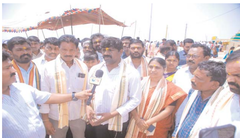
నల్లగొండ, అన్వేషనేత్రం, మే 5: