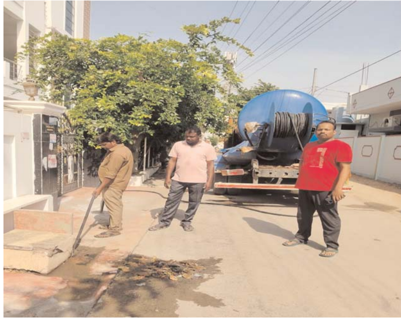
నల్లగొండ లోన్, అన్వేషనేత్రం, మే 4 :