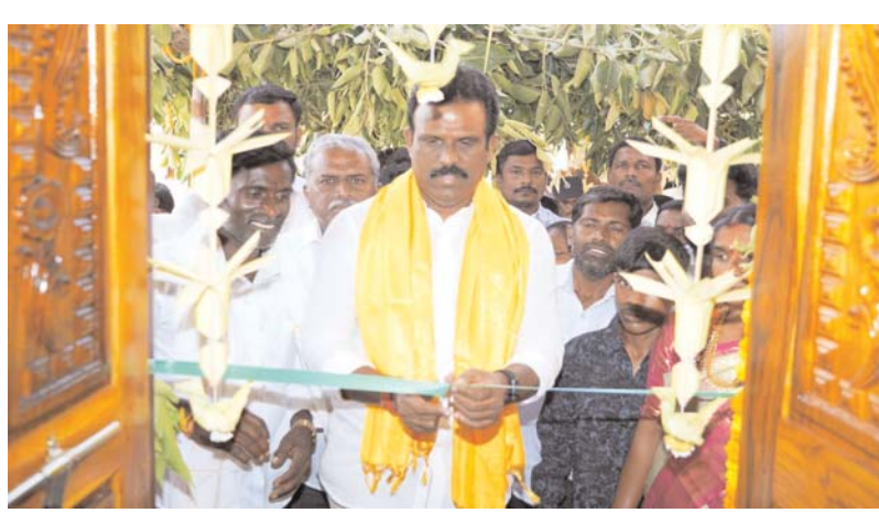
గాంధీభవన్, హైదరాబాద్ :-