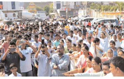
ప్రజా పాలన--ప్రగతి ప్రణాళిక 99 రోజుల కార్యచరణలో భాగంగా, మాదకద్రవ్యాల దుర్వినియోగం నివారణపై