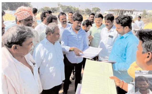
నకిరేకల్ మండలం నియోజకవర్గం

నకిరేకల్ మండలం నోముల మరియు చందుపల్లి గ్రామాల్లో గ్రామీణుల ఆధ్వర్యంలో ఏర్పాటు చేసిన ధాన్యం కొనుగోలు కేంద్రాలను ప్రభుత్వ విప్, నకిరేకల్ ఎమ్మెల్యే శ్రీ వేముల వీరేశం గారు ఆకస్మికంగా తనిఖీ చేసి, రికార్డులను పరిశీలించారు. ఈ సందర్భంగా ఎమ్మెల్యే గారు మాట్లాడుతూ, నోముల చందుపల్లి కొనుగోలు కేంద్రాన్ని తనిఖీ చేశామని, ఈ కేంద్రం నుండి ఇప్పటికే పెద్ద మొత్తంలో ధాన్యం కొనుగోలు