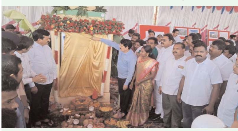
భద్రాద్రి కొత్తగూడెం జిల్లా ప్రతినిధి భద్రాచలం, మే 2 (అన్వేషణ కేంద్రం)