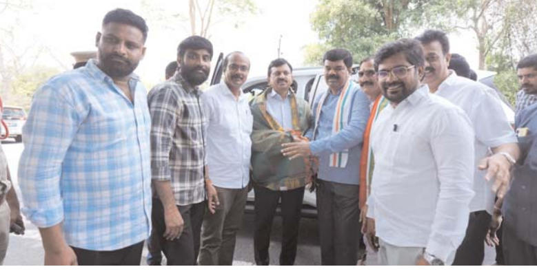
భద్రాద్రి కొత్తగూడెం జిల్లా ప్రతినిధి, భద్రాచలం, మే 2 (అన్వేషణ కేంద్రం):