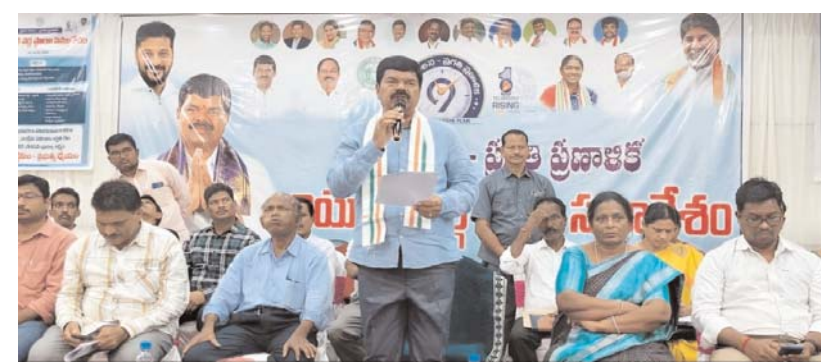
భద్రాద్రి కొత్తగూడెం జిల్లా ప్రతినిధి, ముఖగూడెం మే 02 (అన్వేషణ కేంద్రం):

అధికారులు సమన్వయంతో పనిచేయాలి ఎమ్మెల్యే పాయం వెంకటేశ్వర్లు