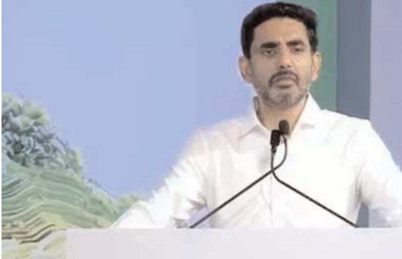
అమరావతి, అన్వేషనేత్రం ప్రతినది

విశాఖ పట్టణం ముఖ చిత్రం ఒక్కరోజు నుంచే మారబోతుందని ఎపి మంత్రి లోకేష్ తెలిపారు. కొత్త చరిత్రకు పునాది వేసిన పవిత్రమైన రోజు అని ఆనాడు అనుకున్న నిర్ణయం ఈనాడు కార్యనిర్వాహక దాఖలందని అన్నారు. విశాఖ: తర్జుమాదాలో గూగుల్ ఎబ డేటా సెంటర్ కు భూమిపూజ చేశారు. కేంద్రమంత్రి అశ్వినీ వైష్ణవ్, ఎపి సిఎం చంద్రబాబు నాయుడు, లోకేష్ భూమిపూజ చేశారు. ఈ సందర్భంగా లోకేష్ మీడియాతో మాట్లాడుతూ.. ఎపి అభివృద్ధిలో పాలుపంచుకోంటున్న ప్రతీ ఒక్కరికీ, ప్రాజెక్టుకు భూములిచ్చిన రైతులందరికీ చూడదుపూర్వక కృతజ్ఞతలు తెలియజేశారు. మొదట ప్రస్తావన జరిగిందని, ఇప్పటివరకు ఒక లెక్క.. ఇప్పటి నుంచి మరో లెక్క అని ఇప్పటి నుంచి విశాఖ.. డేటా ఎబ హాట్ గా పిలుచుకోబోతున్నామని ఇక నుంచి గ్లోబల్ ఐటీ మ్యూష్ లో విశాఖ అనే పవిత్ర పట్టణం ఉండబోతుందని లోకేష్ పేర్కొన్నారు. వైజాగ్ లో జి అంటే గూగుల్ అనే శబ్దం మార్కెట్లో బోంబ్ విధ్వంసం పాలన చూశామని అన్నారు. పరిశ్రమలు ఎపికి రావడానికి మూడు ప్రధాన కారణాలు ఉన్నాయని, ఆ మూడు కారణాలు.. డబల్ ఇంజిన్ ఐటీ రైలు సర్కార్ అన్నారు. చంద్రబాబు నాయకత్వం, స్పీడ్ ఆఫ్ దూయింగ్ బిజినెస్ తో మరిన్ని పెట్టుబడులు రాబోతున్నాయని, డబల్ ఇంజిన్ సర్కార్ తో ప్రయోజనాలు చూపిస్తున్నామని చెప్పారు. సమాచార కొత్త అర్థం చెబుతున్నానని, సమాచారం అనే నాయుడు, మోడీ అని అన్నారు. పెట్టుబడులతో ఆంధ్రప్రదేశ్ చరిత్ర సృష్టిస్తోందని లోకేష్ కొనియాడారు.