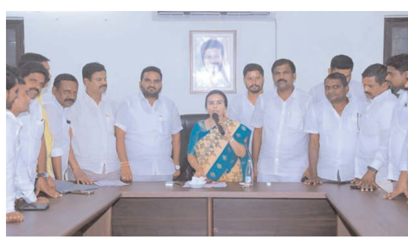
ప్రభుత్వ చిత్తశుద్ధికి జేపీసీ నేతల హర్షం