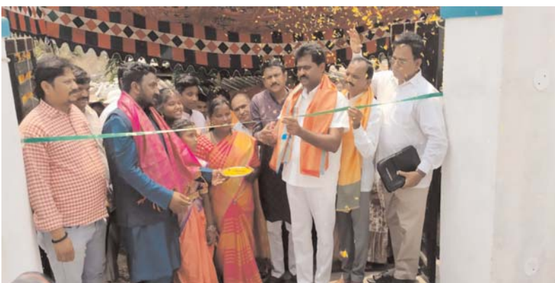
సత్కారం దొన్, అన్వేషణ, ఏప్రిల్ 25: