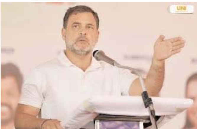
మణిపుర్ తరహాలోనే అన్ని రాష్ట్రాల్లో అధికారం గుప్పిట్లో పెట్టుకుని ఢిల్లీ నుంచి పాలించాలన్నదే బీజేపీ ఉద్దేశమని రాహుల్ అన్నారు. తమిళనాడులోనూ ఇప్పుడు అన్నాడీఎంకేను కంట్లోలో పెట్టుకుని ఢిల్లీ నుంచి పాలించాలనుకుంటోందని ఆరోపించారు. 'ఎక్కడ అవకాశం ఉంటే అక్కడ అధికారాన్ని