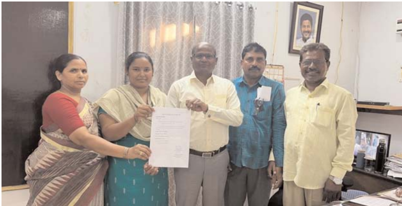
సూర్యాపేట జిల్లా స్టూన్ ఏప్రిల్ : 17 (అన్వేషనేత్రం)