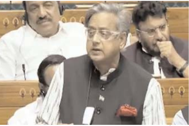
శశిధరూర్ తెలిపారు. కేంద్ర ప్రభుత్వం మహిళా రిజర్వేషన్ బిల్లు తీసుకురావడం మంచిదేనని, అయితే దీని అమలుకు

పార్లమెంటులో లోక్సభ, శాసనసభ నియోజకవర్గాల పునర్విభజన (డీలిమిటేషన్) అంశంపై చర్చ తీవ్రపాటు దాల్చింది. జనాభా అధారంగా సీట్ల సంఖ్యను పెంచాలనే ఉద్దేశ్యంతో, కేంద్ర ప్రభుత్వం డీలిమిటేషన్ ప్రక్రియకు సంబంధించి చొరవ తీసుకుంటోంది. అయితే డీలిమిటేషన్ బిల్లును ప్రతిపక్ష పార్టీలు వ్యతిరేకిస్తున్నాయి. ఇవాళ(శుక్రవారం) రెండో రోజు కూడా డీలిమిటేషన్ బిల్లుపై చర్చ జరుగుతోంది. డీలిమిటేషన్తో దక్షిణాది రాష్ట్రాలకు నష్టం జరుగుతుందని కాంగ్రెస్ ఎంపీ శశిధరూర్ అన్నారు. లోక్సభలో ఆయన మాట్లాడుతూ.. దక్షిణాది రాష్ట్రాలకు నష్టం జరగడం ప్రధాని మోడీ, కేంద్ర చోం మంత్రి అమిత్ షా మాట్లాడుతున్నారని, వారి మాటలకు విరుద్ధంగా డీలిమిటేషన్ బిల్లు రూపొందించారని ఆయన విమర్శించారు. డీలిమిటేషన్తో దక్షిణాది రాష్ట్రాలు రాజకీయంగా మరింత నష్టపోతాయని